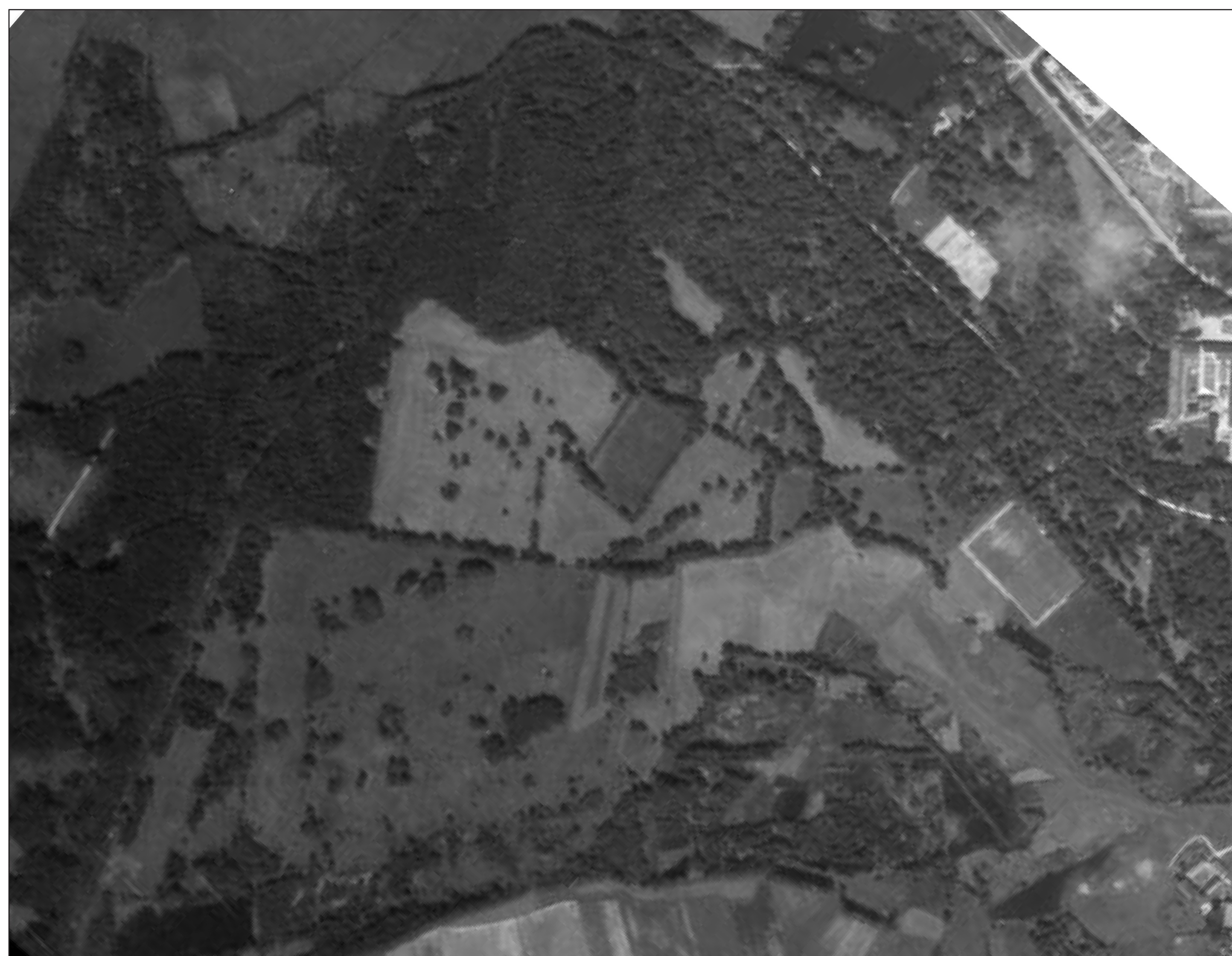
Výřez snímku vojenského mapování z roku 1948

Komponované prvky krajinných struktur nově vytvořené (záměrná změna v procesu přestavby rozsáhlých zahradních úprav na hospodářský les v období do roku 1989. Toto zalesnění vedlo k vytvoření nových krajinných dominant ve formě lesních komplexů Lesopark Amerika a Wiedmanův park.